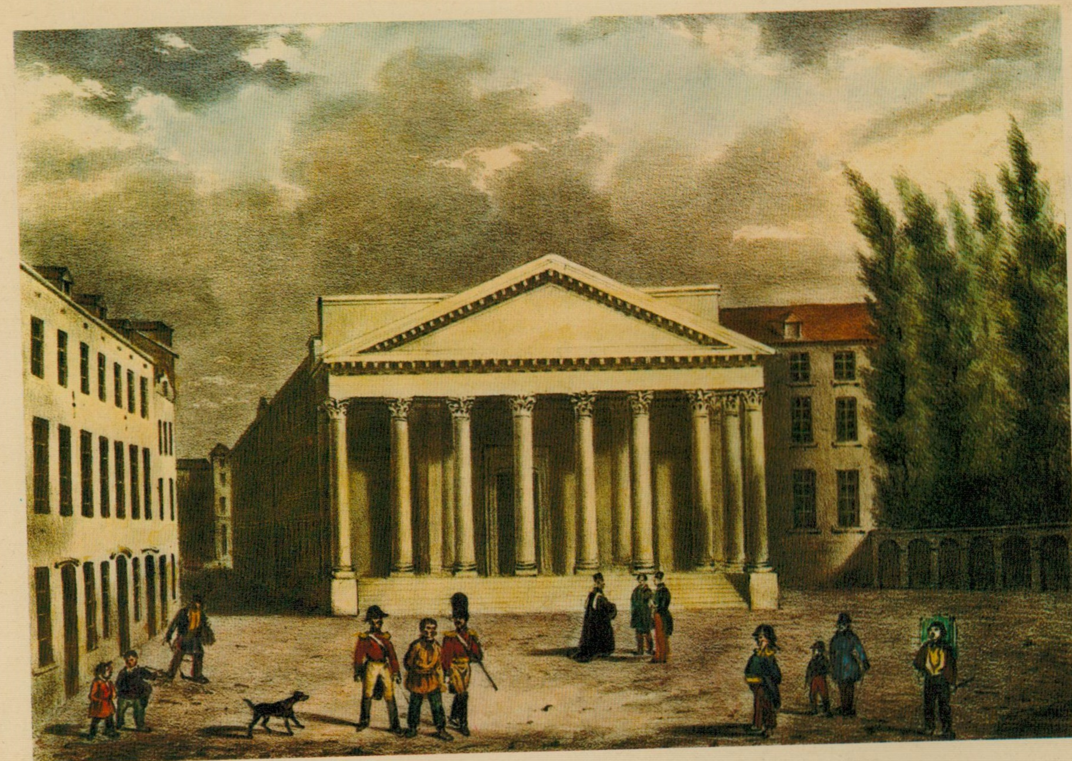
Palais de Justice